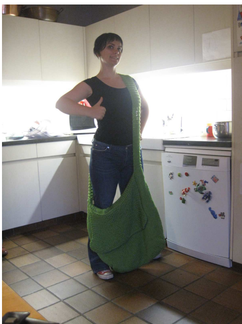
AVANT LE FEUTRAGE